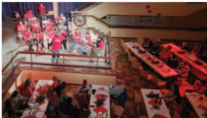
Schülerorchester auf der Bühne

Am vergangenen Samstag fand unsere diesjährige Weihnachtsfeier in der Aula der Schwarzwaldschule statt. Verschiedene Darbietungen der unterschiedlichen Altersstufen und vieler jungen Talente begeisterten das Publikum.