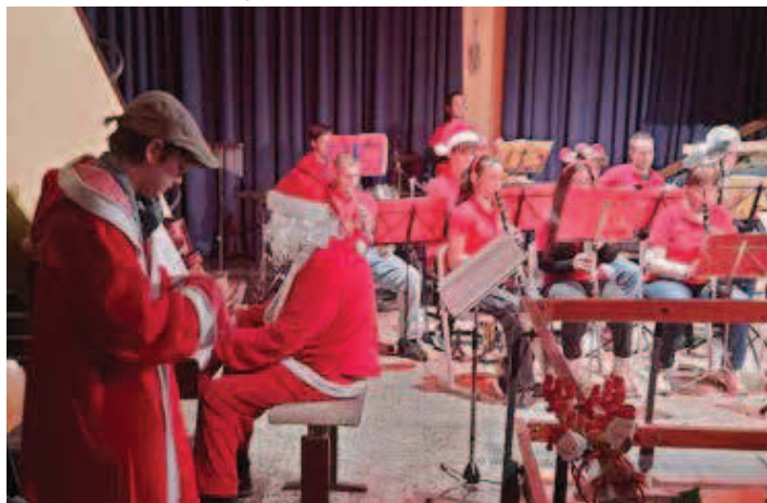
Mittendrin unser musikalischer Nikolaus mit seinem jungen Azubi.