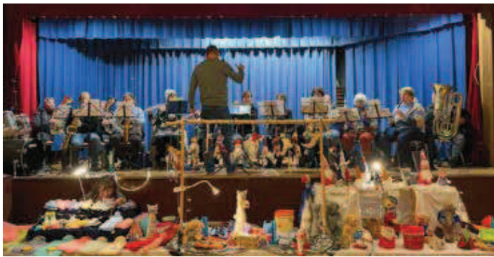
Vorweihnachtliche Stimmung bei der Eintracht

Bereits am Vortag, 25.11., traten wir beim Adventszauber der Eintracht-Fasenachter auf. Es hat uns ganz besonders gefreut, dass uns unsere Vereinsfreunde eingeladen haben, den Mörscher Christkindlesmarkt musikalisch zu begleiten. Unser abwechslungsreicher Mix aus feierlichen Adventsliedern und stimmungsvoller Unterhaltungsmusik kam beim Publikum gut an.