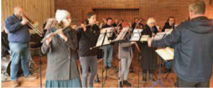
Feierstunde auf dem Mörscher Friedhof